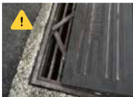
車乗り入れブロック