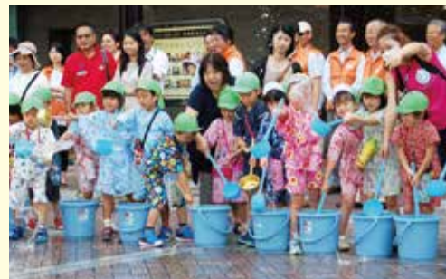
昨年の横浜駅西口 打ち水の様子