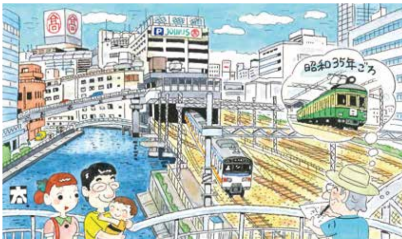
題字・絵・文：鈴木太郎(西区文化協会)